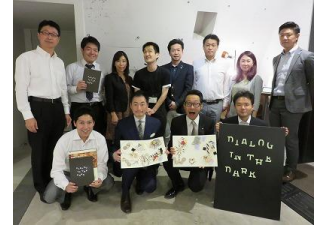
DID アテンドスタッフと