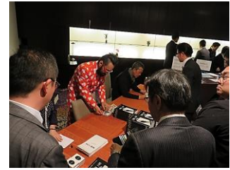
書籍販売・サイン会