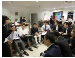
プログラムの説明を受ける

「暗闇のソーシャルエンターテインメント」