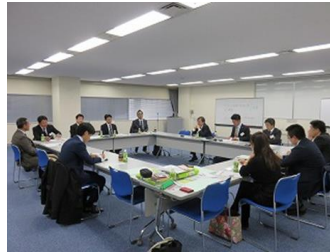
ディスカッション