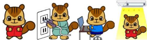
川口工業マスコット「かわり」くん