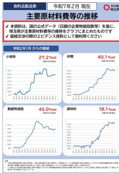
価格交渉支援ツール