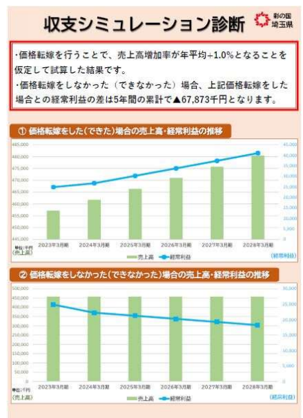
収支計画シミュレーター