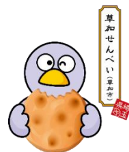
埼玉県のマスコット コバトン